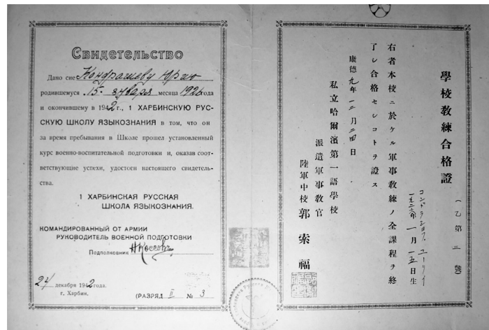
Свидетельство об окончании Харбинской русской школы языкознания.

В 1942–1945 годах обучался на политехническом факультете, а затем на коммерческом отделении СМУ.