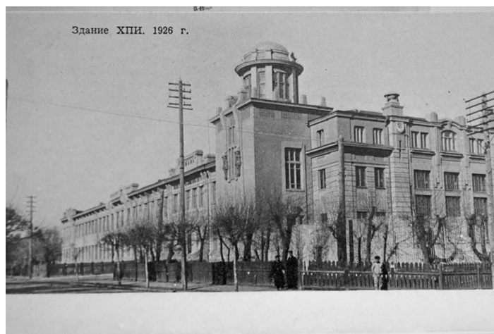
Здание Харбинского политехнического института, в котором располагался Северо-Маньчжурский университет, 1926 год.

В некоторых публикациях спецобъект № 45 называют «спецобъектом 2045», с прямым подчинением Москве и Сталину, но в официальных документах это не подтверждается, он упоминается только как «спецобъект № 45».