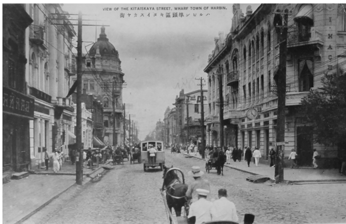
Вид на Китайскую улицу в г. Харбине, начало 1920-х годов.

В статье журналиста О. Бобина «Осколок Российской империи» есть замечательные слова о переводчиках, которые прибыли в СССР из г. Харбина: «Всё реже встретишь уникальных переводчиков с китайского, что были выходцами из этого города. Язык они познавали с детства на улицах, как бы между делом. Благодаря им на всех уровнях долгие годы обеспечивались контакты с нашим соседом Китаем во время встреч делегаций различных уровней, и всегда обе стороны предпочитали общение через “харбинцев”» [1, с. 36].