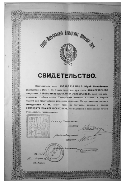
Свидетельство Северо-Маньчжурского университета.