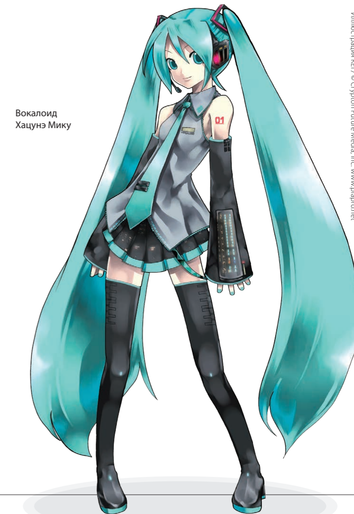
Вокалоид Хацунэ Мику

Благодаря продажам сборных альбомов на компакт-дисках, концертам и сотрудничеству с компаниями, популярность Хацунэ Мику достигла уровня живых исполнителей, а, может быть, даже и превзошла его. Через Интернет виртуальная певица получила также широкую известность в Европе, Америке и Азии. В США в 2011 году Хацунэ Мику появилась в рекламе японских автомобилей.