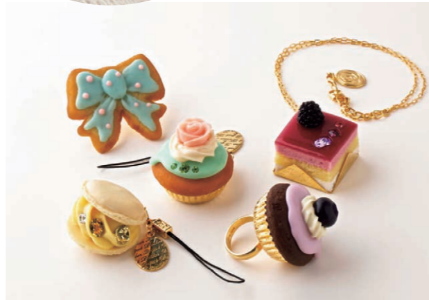
ФОТО ВНИЗУ: Бренд "Q-rot.", известный своими реалистичными аксессуарами в виде сладостей.

ФОТО СЛЕВА: Трёхмерный маникюр с бантиками и медвежатами из акрила.